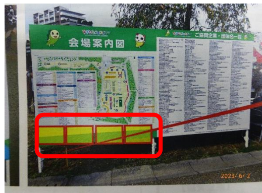
案内看板 (場内6看板設置。看板ごとに4枠 広告配置。6×4=24 24枠のうちの1枠)