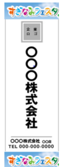
フラッグ広告 (イメージ)