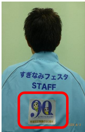
ジャンパー広告 (職員約200人着用)