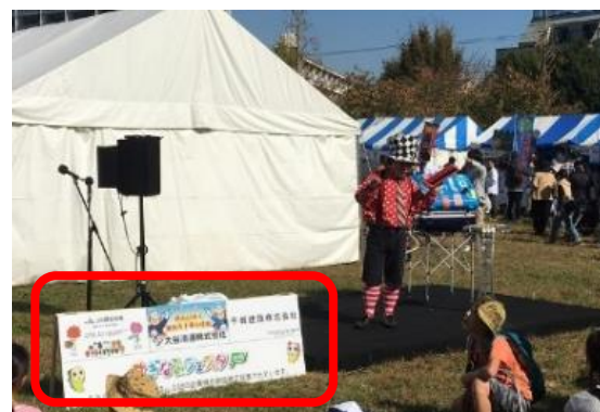
ミニ・ステージ広告