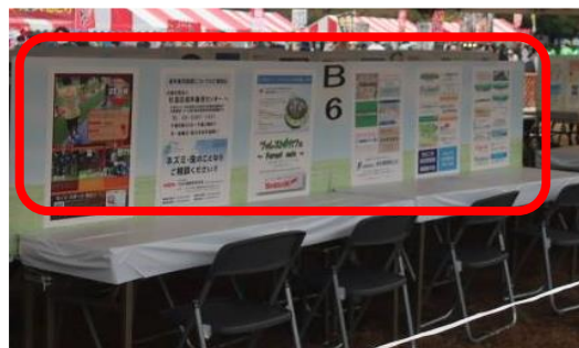
ポスター広告 (食事スペースに設置)