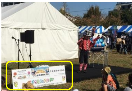
ミニ・ステージ広告