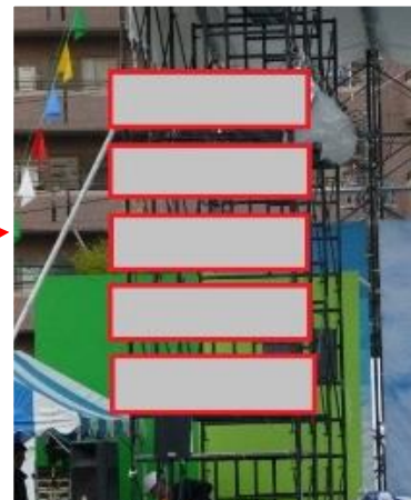
ステージ広告のイメージ