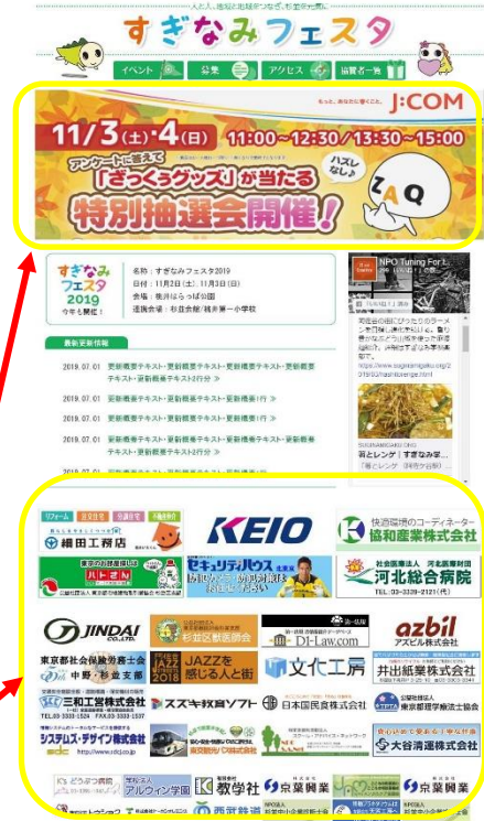
ホームページ広告のイメージ